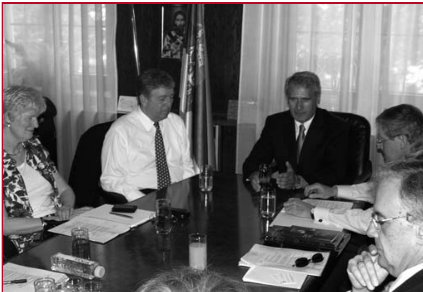
ЊКВ Александар Карађорђевић и делегација Универзитета у Нотингему у посети нашем Факултету

Након пријема у деканату делегација је обишла наш Факултета, а затим је свечано отворен Career Center . Разговор са делегацијом