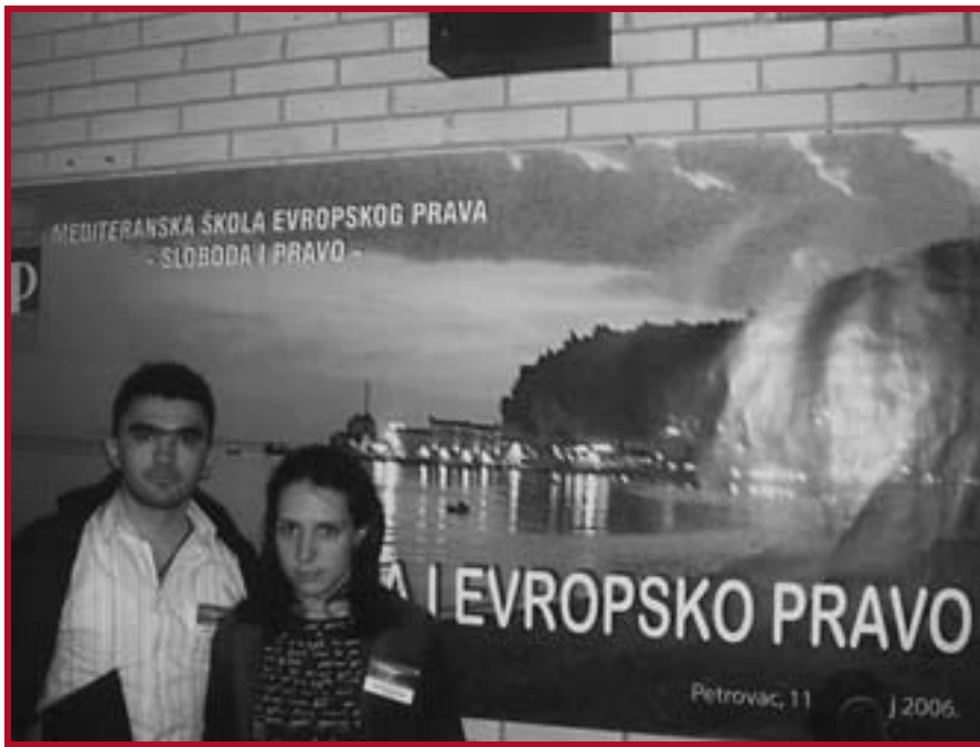
Наши студенти на Медитеранској школи европског права у Петровцу

На предавању г. Пјетра Грасо студенти нашег Факултета су имали прилику да сазнају више о методима борбе против организованог криминалитета, а нарочито мафије, која се одавно води у Италији. Циљ борбе је, како је истакао тужилац Грасо, да се разбију организације, похапсе њени људи и заплене сва богатства, ефикасно сузбије илегална трговина, итд. Мафија је убијала судије, припаднике полиције, политичаре, свештена лица, жене и децу, али и новинаре који су се трудили да против ње окрену јавно мњење, тако да се мафија понаша попут тоталитарног система који убија све који му се супротстављају. Наднационални карактер криминалних организација се развио пре свега услед врсте робе којом се тргује: предњаче дрога, оружје и новац. Један од примера удруживања криминалних организација јесте договор између сицилијанске мафије и Меделиновог картела из Колумбије, који је имао за циљ да Европу преплави колумбијским кокаином и лажним доларима и да послужи као простор за прање илегалних добити.