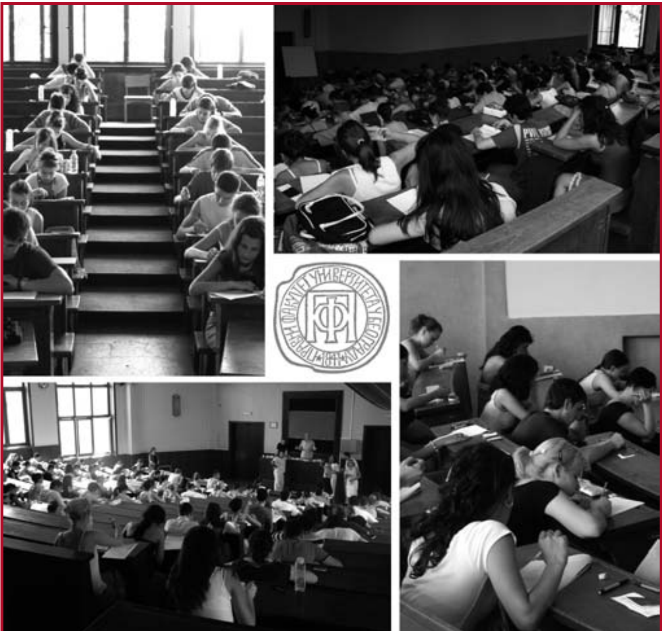
Полајање пријемног испитија у амфијатрима нашег Факултетија

Правни факултет Универзитета у Београду је, на основу Одлуке Владе