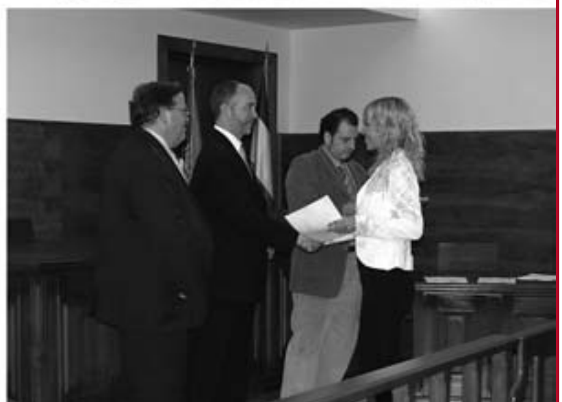
Амбасадор САД Мајкл Полт на нашем Факултету