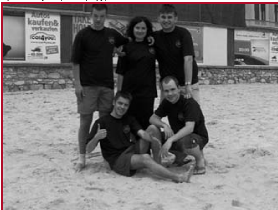
Наши студенти на фудбалском турниру на песку у Грацу