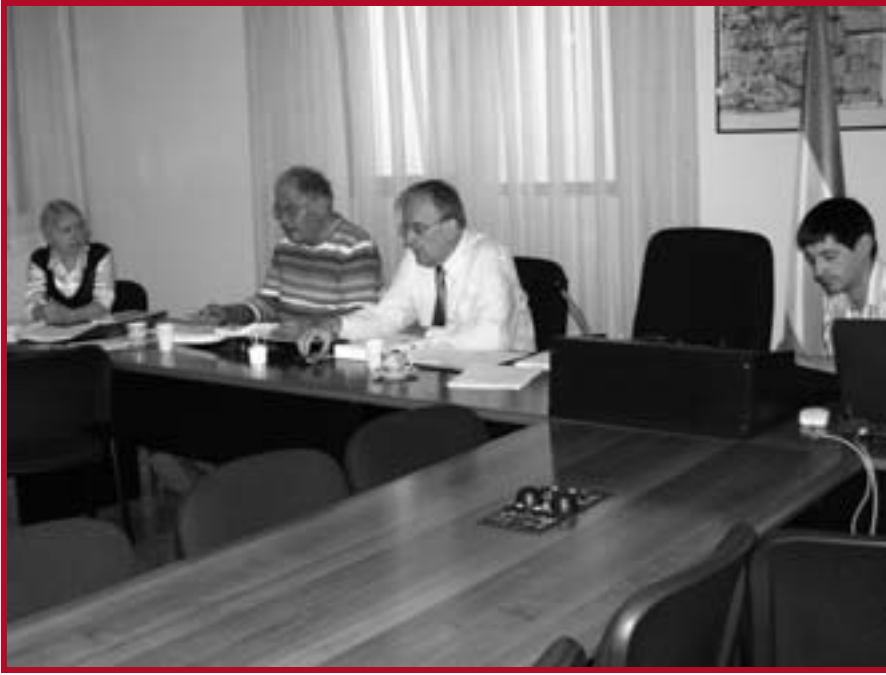
Радни састајанак поводом Темјус пројекта „РОGESTEI“