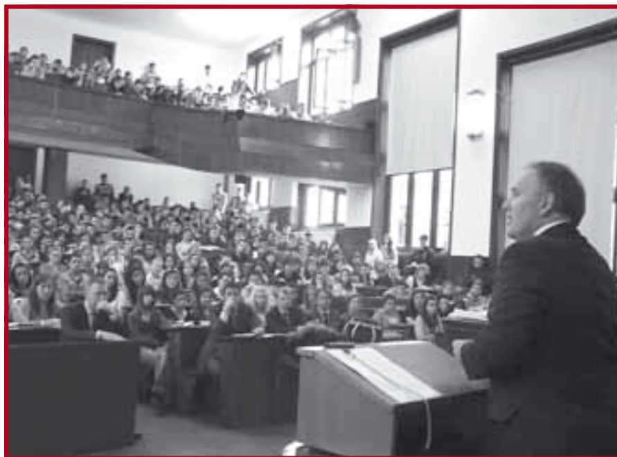
Министар за европска питања Холандије на предавању у амфитеатру V