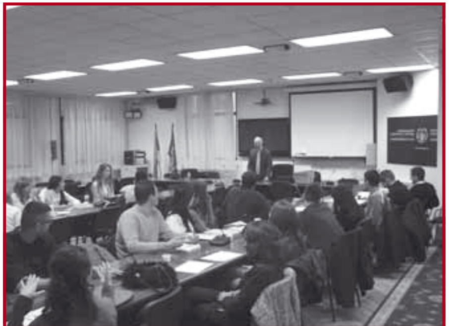
Полазници курса Introduction Into the European Union Law