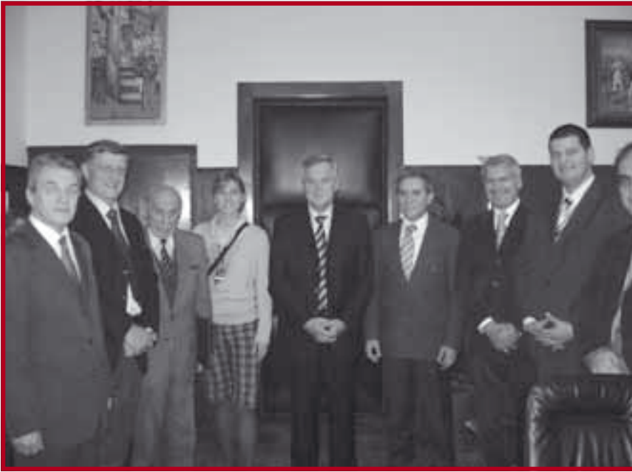
Организатори Конференције са уваженим гостима из иностранства