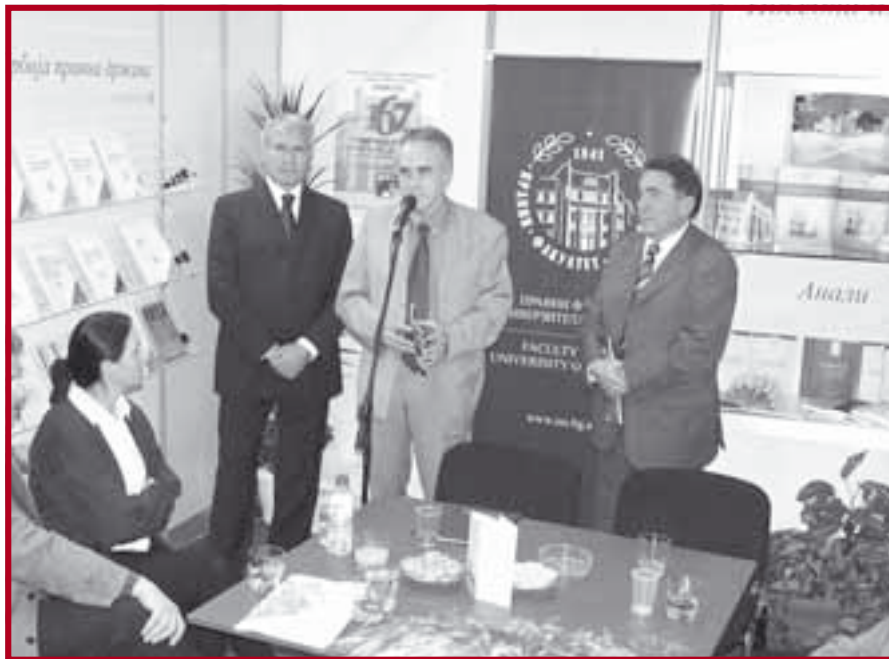
Централна промоција издања Центра за публикације Правног факултета

Они су истакли да издавачка концепција Центра за публикације Правног факултета почива на враћању традицији правне државе и представља подухват планираног „знања ослоњеног на традицију“.