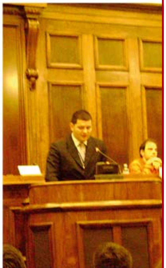
Са отварања Конференције у дому Народне скупштине

га Јовановића, учешће узели и угледни професори са правних и историјских школа почев од Сорбоне, чувеног јерусалимског Хибру Универзитета, Руске Државне Дипломатске Академије МДИМ, Руске Академије Наука, Данске па све до