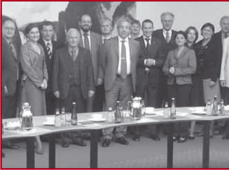
Учесници окрулог стола „Flexibilität der Grundpfandrechte in Europa“

ма које се односе на положај хипотекарних поверилаца у поступку намирења (вансудског и судског), као и у стечајном поступку.