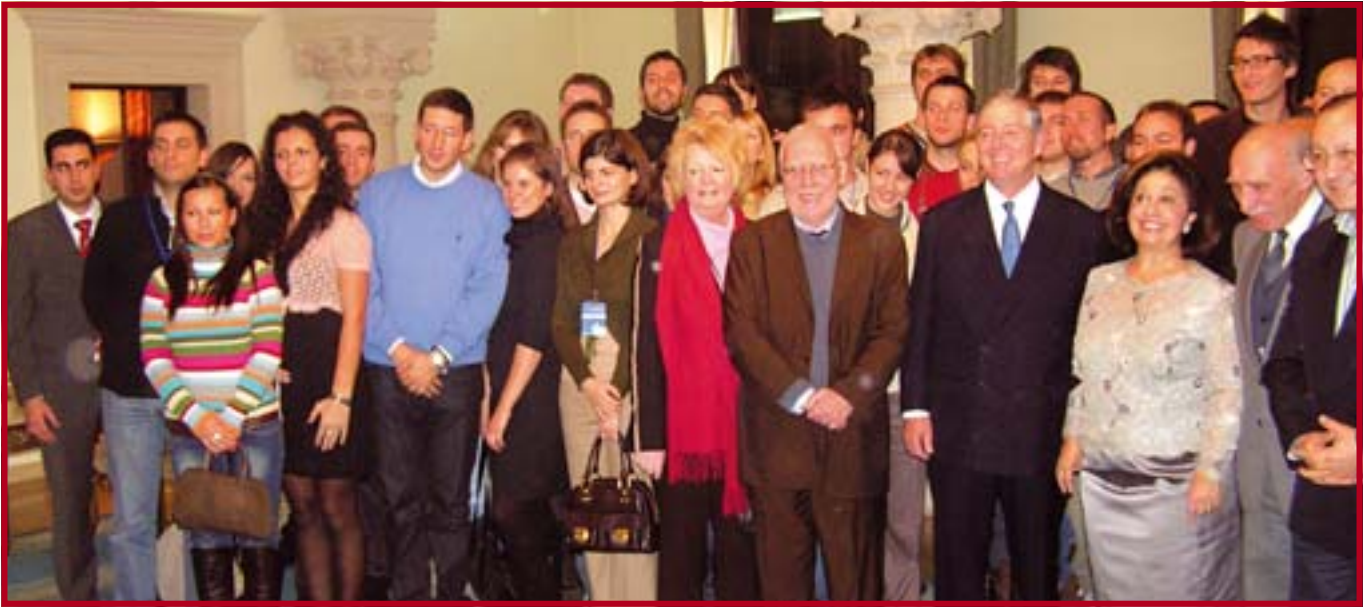
Учесници Конференције Косово и Метохија као глобални проблем у посети Белом двору

ноћења у Уранополису и посете Какову, оближњем метоху манастира Хиландара, пут је настављен за Солун. Тамо су нас ишчекивали црква Св. Димитрија, Галеријев славолук, Ротонда и други остаци царске палате овог римског императора, величанствен поглед са брега који се уздиже изнад града, моћне зидине које га опасују, византолошки и археолошки музеј, као и многе друге културне знаменитости. С друге стране, тржни мега-центар изван Солуна задовољио је умногоме и потребе за овоземаљским ужицима.