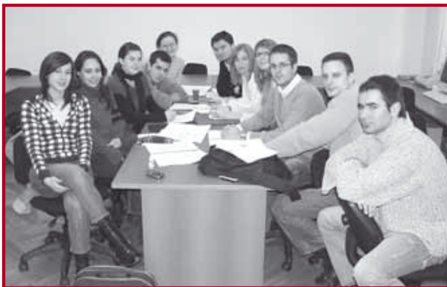
Тим Правног факултета за учешће на XV Willem C Vis International Commercial Arbitration Moot-y

Од октобра месеца 2007. године, формиран је тим Правног факултета, који се припрема за такмичење из Међународног јавног права, Jessup Moot Court 2008 . Тим чине: