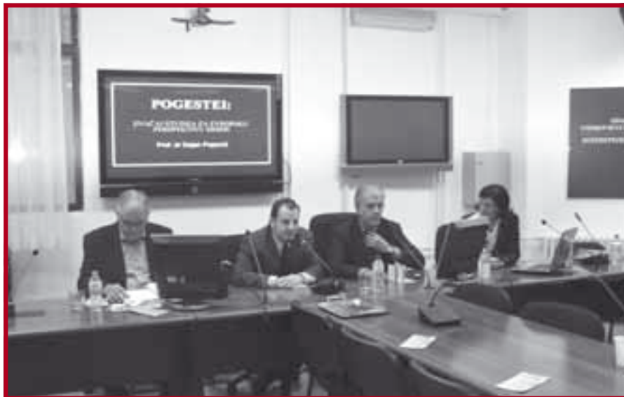
Са презентације нових дипломских академских студија Мастер европских интеграција

Договорено је да настава на овом програму почне 15. фебруара 2008. године и траје до 15. фебруара 2009. године. Наставу на енглеском језику држаће професори Правног факултета Универзитета у Београду, у сарадњи с гостујућим предвачима из Конзорцијума европских фа-