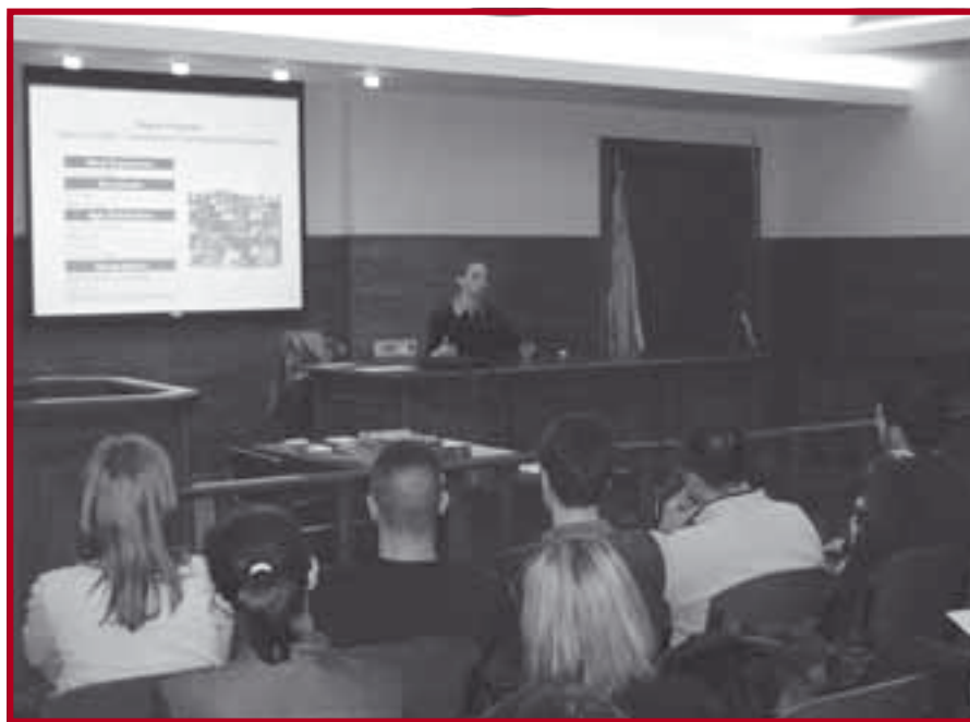
Презентација Кенеди школе за јавну управу Универзитета Харвард и Кокалис програма за централну и источну Европу

Аутору првопласираног рада биће додељена новчана награда, а рад ће бити објављен у часопису Ревивија за криминологију и кривично право. Аутору другопласираног рада биће додељен комплет књига. О поступку пријављивања више видети на веб сајту Правног факултета. ■