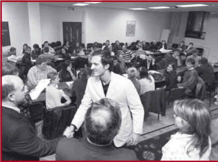
Додела сертификата полазницима курса Закон, законодавство и законодавна политика