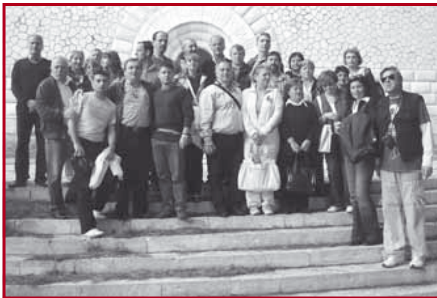
Испред костурнице палим српским ратницима на острву Виду

„Планирана посета Хиландару нажалост није остварена (због проблема око улазне визе), али је обилазак бродом дуж обале Свете Горе пружио могућност бар делимичног упознавања са лепотама ове јединствене монашке заједнице. После