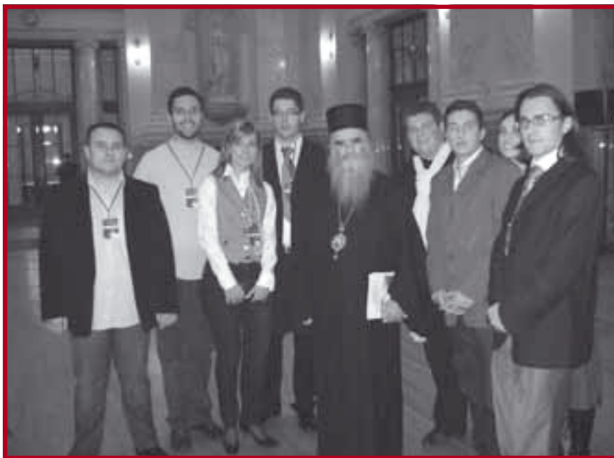
Митрополит црногорско-приморски Амфилохије са студентима организаторима Конференције