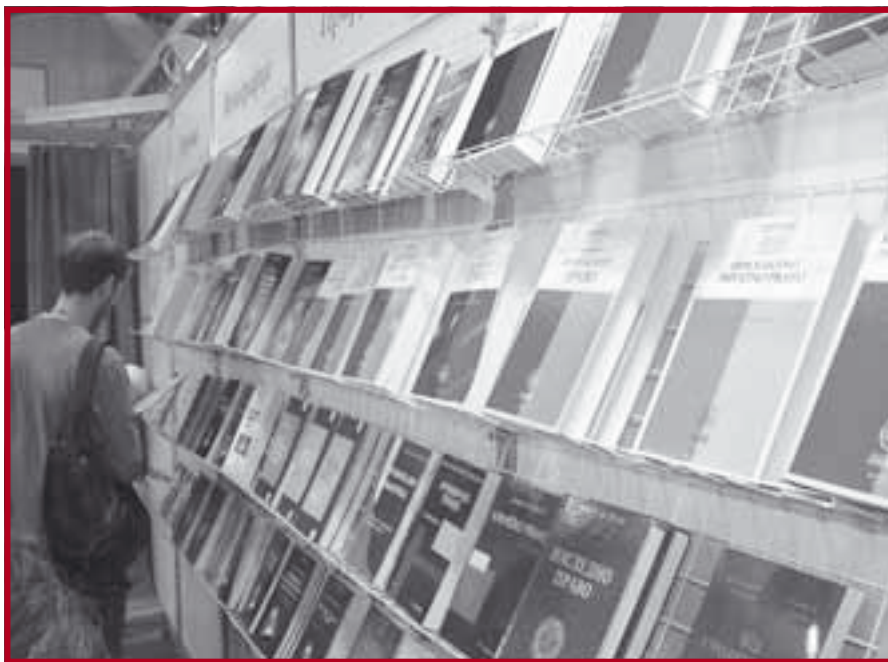
Нова издања Центра за публикације Правног факултета

Реч је о пројекту који тежи да окупи ауторе који поштују своју прошлост, разумеју садашњост и ус-