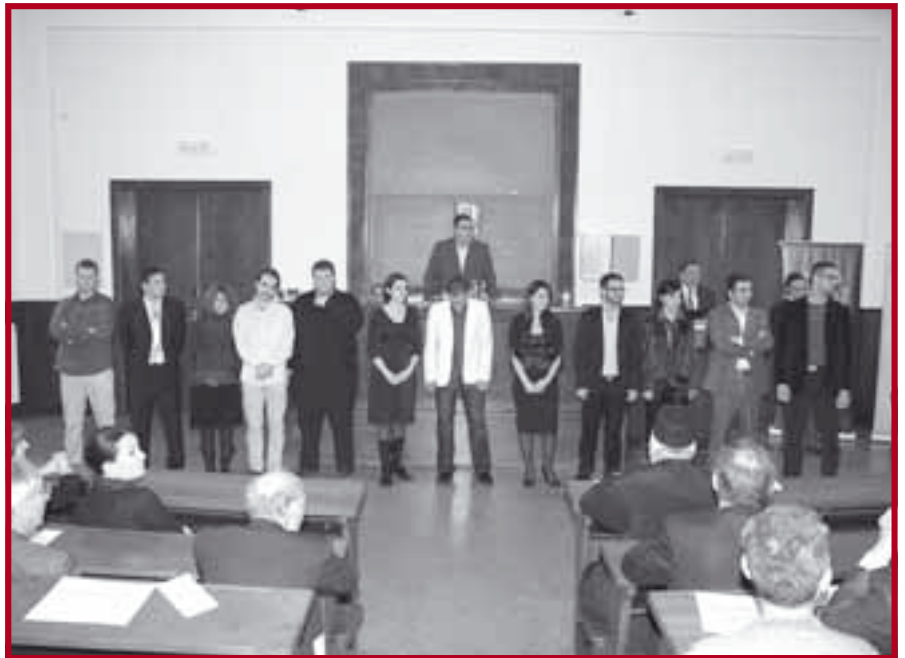
Учесници XIV такмичења у беседништву

Као и раније, такмичари су се надметали у три беседничке категорије: слободна тема, задата тема и импровизација. Ове године задате теме су биле: Невоља овог света је што су мудраци пуни сумње, а бу-