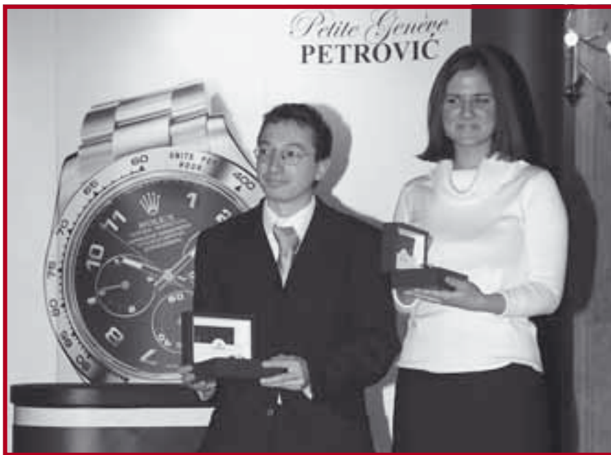
Лауреати награде „Круна успеха“

професије. Строги критеријуми конкурса за доделу ове награде подразумевали су окончање студија са просечном оценом вишом од 9.0, писање есеја и интервју, а у