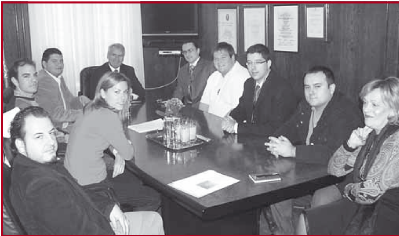
Студенти организатори Међународне конференције „Косово као глобални проблем“ на пријему у Деканату

10. децембра 2007. године декан и управа Правног факултета свечано су примили сту-