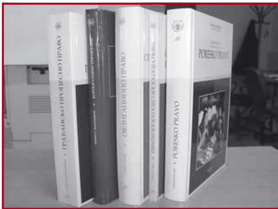
Нова издања Центра за публикације Правног факултета

У оквиру библиотеке „Монографије“: Корпоративно управљање – правни аспекти , прво издање, ау-