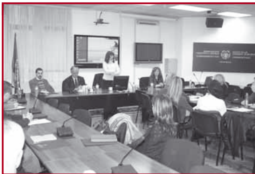
Са отварања специјалистичких студија „Порески саветник“

У настојању да на прави начин одговори потребама нашег тржишта у специјализацији тражених кадрова, Правни факултет Универзитета у Београду по други пут са успехом организује специјалистички курс из области пореског саветовања. Настава на курсу, за који се пријавило 39 кандидата, отпочела је 18. јануара текуће године. У укупном фонду од 110 часова полазници курса стичу актуелна знања из свих области релевантних за обављање позива пореског саветника. У жељи да се полазницима курса поред неопходних теоријских знања укаже и на практичне проблеме, поред стручњака са нашег Факултета, наставу изводе и позната имена из праксе. Полагањем завршног испита полазници