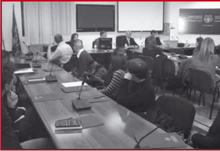
Са предавања на специјалистичким студијама „Корпоративно управљање“

курса стичу звање Специјалисте за пореско саветовање.