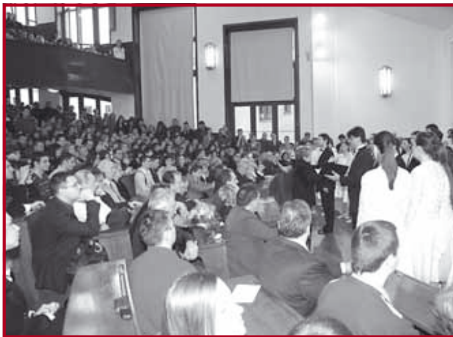
Са прославе Дана Светог Саве