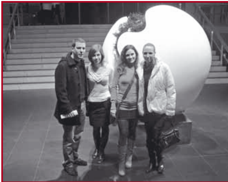
Чланови тима Правног факултета на такмичењу у Хагу

На такмичењу је учествовало дванаест екипа из десет земаља и то Канаде, Индије, Немачке, Чилеа,