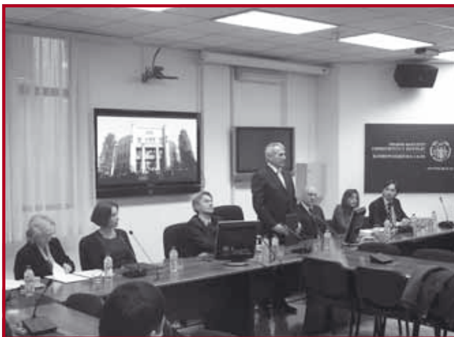
Свечано потписивање уговора о сарадњи са београдским судовима

Пракса у судовима је намењена студентима који прате вежбе из предмета кривично процесно право и грађанско процесно право, а резултати које буду постигли биће вредновани од стране судија предавача, као предиспитна активност при полагању усменог дела испита из поменутих предмета.