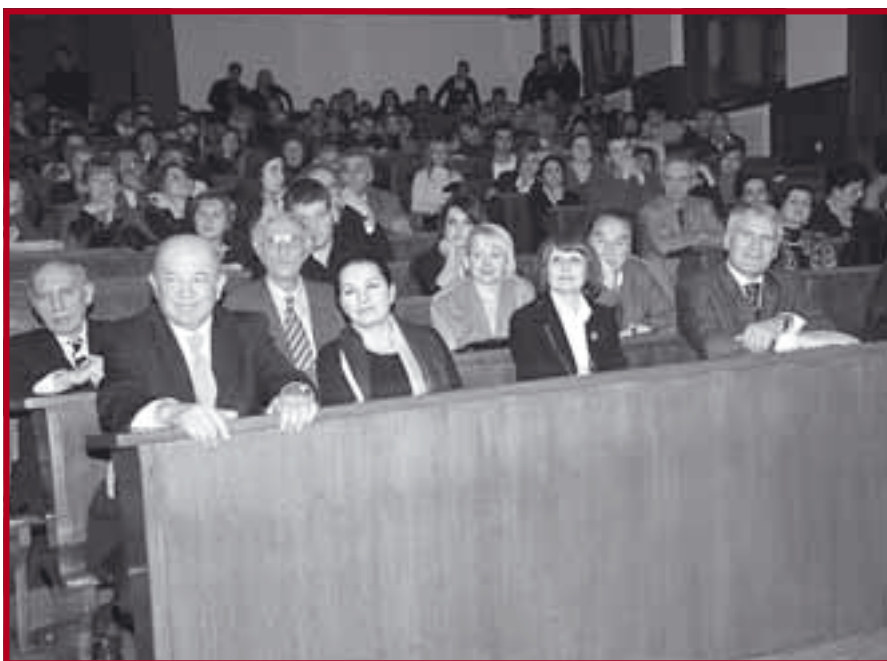
Чланови стручног жирија