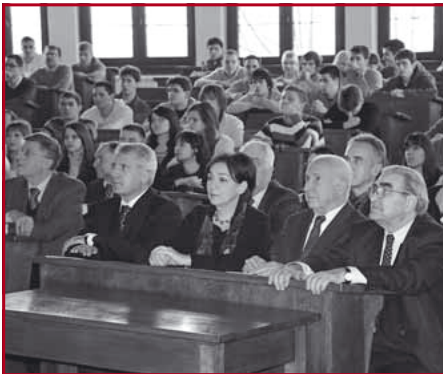
Учесници академије слушају снимак Јовановићевог говора од 1943. године

новћа, које, расуто у стотине библиографских јединица и до сада недовољно познато широј правничкој и друштвеној јавности, свакако заслужује посебну пажњу наше науке, како би тиме постало незаобилазни део нашег културног наслеђа и темељна одредница нашег културног обрасца. Дуг који имамо према овом корифеју нашег Факултета нећемо испунити само објављивањем његових књига и организацијом оваквих и сличних академија, али ћемо га испунити ако, уз то, непрестано уносимо у свој лични и заједнички посао колико год можемо – истрајности, истинољубивости, правдољубивости, искреног патриотизма и самопрегора који је наш, у свему, велики професор Слободан Јовановић уносио у своја дела.“