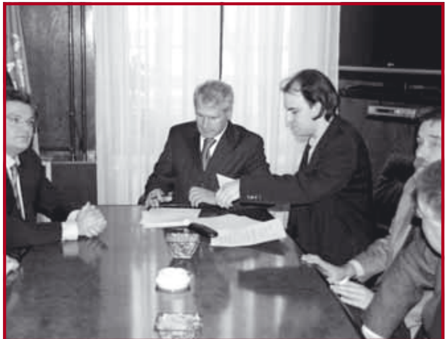
Потписивање уговора о оснивању фонда „Осмех на дар“

Студенти су посетили велики број места на Косову и Метохији – Прилужје, Бабин Мост, Прековце, Паралово, Церницу, Пасјане, Ранилуг, Шилово (у коме су била и деца из Гњилана и Доњег Ливоча) и поделили деци око 2000 пакетића. Поред тога што су посетили основне школе и обданишта у овим местима, студенти су употпунили базу контаката са људима са Косова и Метохије, коју ће наставити да користе како би помогли онима којима је помоћ најпотребнија. У посебном сећању студената остаће забележена и посета Дому за децу заосталу у развоју у Грачаници, као и одлазак мањег броја студената у Призрен и манастире разорене 2004. године. Несебичну помоћ у реализацији акције студентима су пружиле колеге