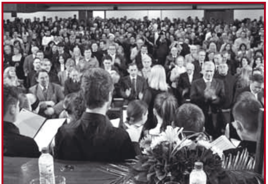
Свечано отварање овогодишњег такмичења у беседништву

постало нека врста брэнда Правног факултета и препознатљив догађај у нашој престоници. Овогодишње такмичење, према ре-