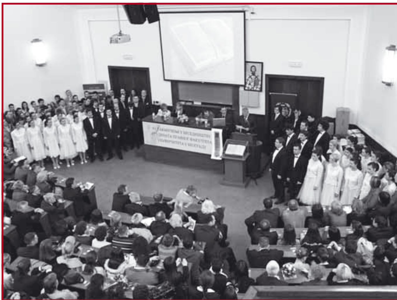
Са свечане прославе Дана Светог Саве