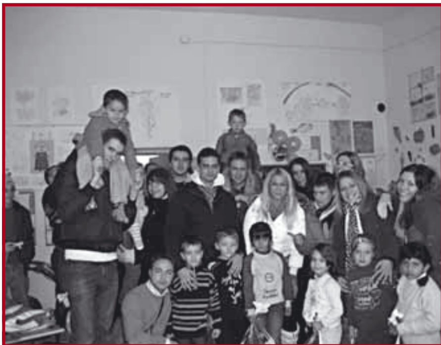
Својом посетом и поклонима студенти су обрадовали малишане на Косову и Метохији

На Косово и Метохију је 27. децембра 2008. године отпутовало око 40 студената да најмлађим житељима српске покрајине честита новогодишње и божићне празнике и да их обрадује припремљеним пакетићима. Студентима се придружила и група пријатеља из Осијека, носећи више од 100 пакетића које су послале породице из Славоније.