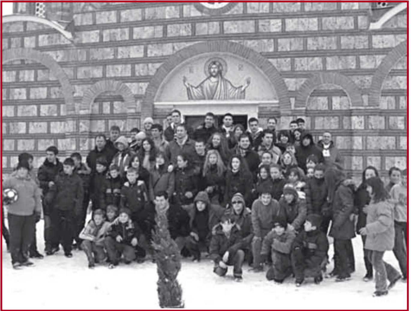
Студентска делегација Правног факултета са малим домаћинима

Студенти су посетили велики број места на Косову и Метохији – Прилужје, Бабин Мост, Прековце, Паралово, Церницу, Пасјане, Ранилуг, Шилово (у коме су била и деца из Гњилана и Доњег Ливоча) и поделили деци око 2000 пакетића. Поред тога што су посетили основне школе и обданишта у овим местима, студенти су употпунили базу контаката са људима са Косова и Метохије, коју ће наставити да користе како би помогли онима којима је помоћ најпотребнија. У посебном сећању студената остаће забележена и посета Дому за децу заосталу у развоју у Грачаници, као и одлазак мањег броја студената у Призрен и манастире разорене 2004. године. Несебичну помоћ у реализацији акције студентима су пружиле колеге