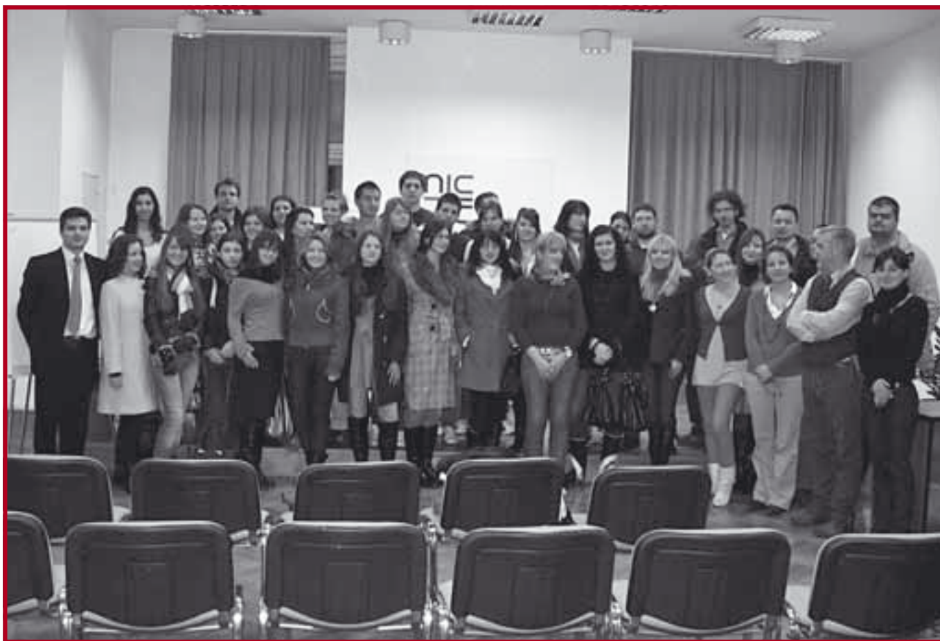
Студентска посета Министарству културе