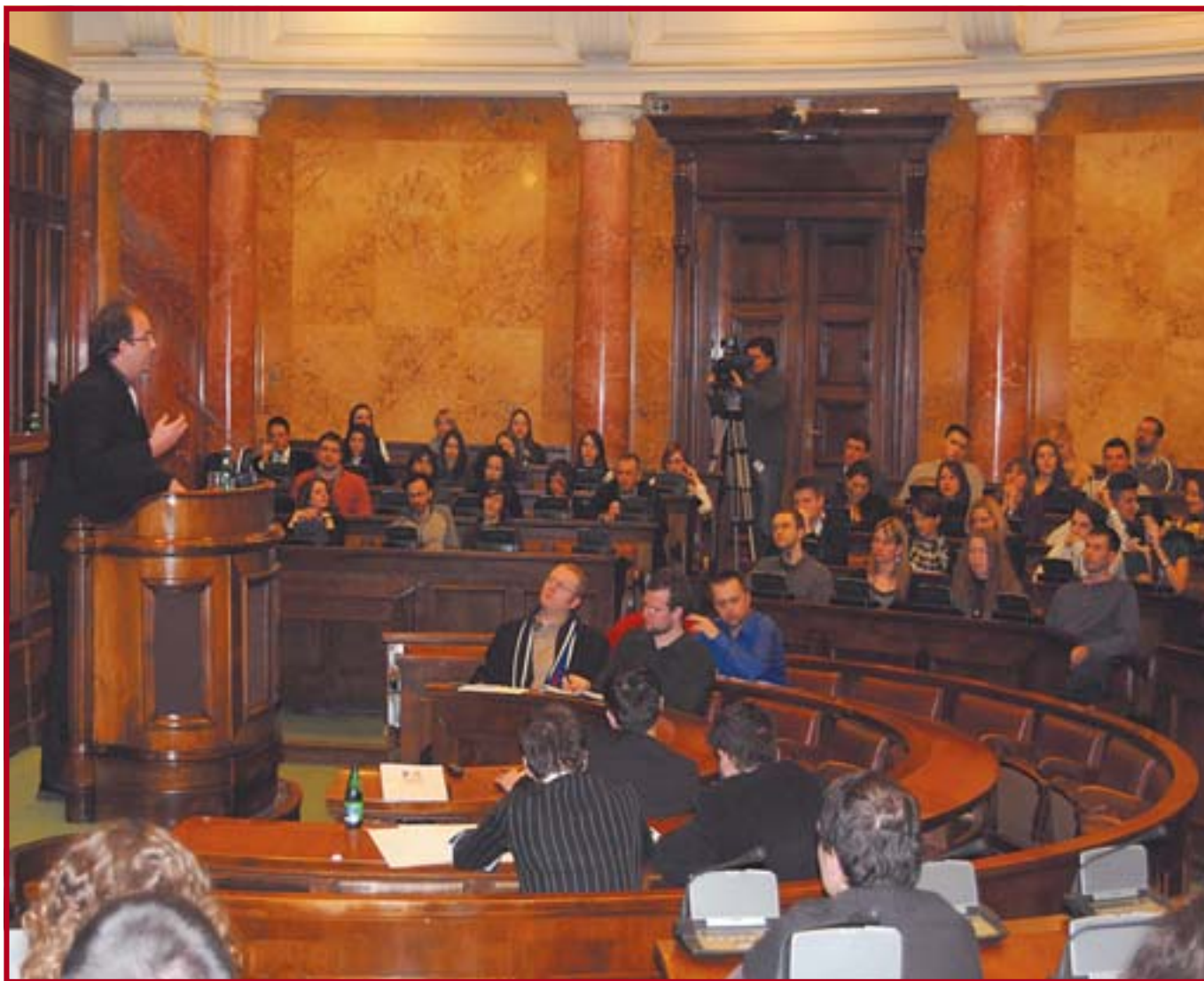
Финална дебата у Дому Народне скупштине

најаву рунди и компјутерску обраду података (ТАВ собу). Поред тога велику олакшицу организаторима