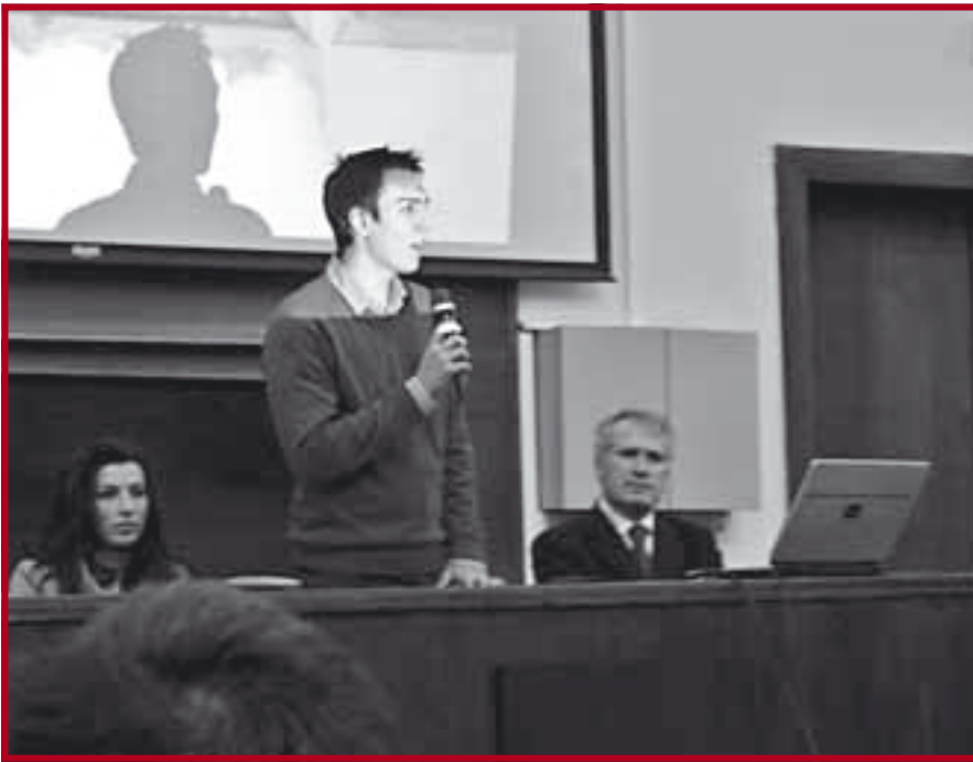
Са оснивачке скупштине фонда „Осмех на дар“

са Правног факултета Универитета у Приштини (тренутно у Косовској Митровици) и други пријатељи из Косовске Митровице. Студентска посета Косову и Метохији забележена је и видео-камером, док се филм о студентској акцији, који је више пута био емитован на телевизији, може погледати на интернет адреси http://www.youtube.com/watch?v=aghfRNjAUpQ .