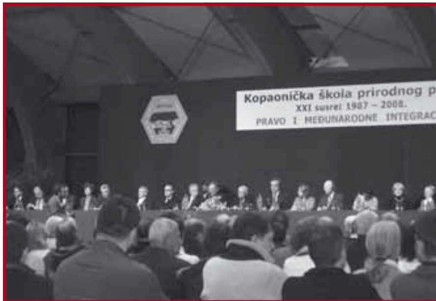
Са XXI сусрета Копаоничке школе природног права