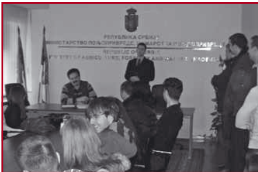
Наши студенти у посети Министарству пољопривреде, шумарства и водопривреде РС