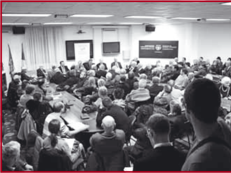
Конференцијска сала била је претесна да прими све који су желели да присуствују састанку Општег семинара