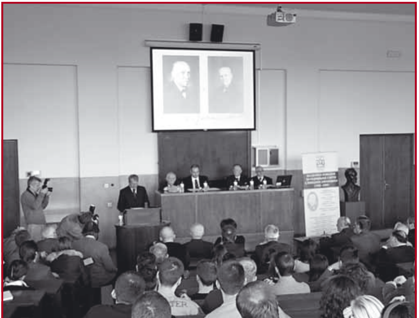
Отварање академије поводом 50-годишњице смрти Слободана Јовановића