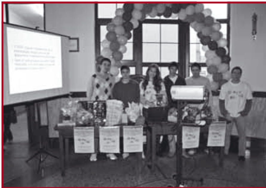
Прикупљање пакетића на Правном факултету

Уочи доласка нове 2009. године, студенти Правног факултета организовали су, сада већ традиционалну, хуманитарну акцију „Осмех на дар“. Трећа по реду акција била је најмасовнија до сада, будући да су, поред великог броја студената Правног факултета, у њој учествовали и студенти других факултета Универзитета у Београду, укључујући студенте Факултета политичких наука, Грађевинског, Економског, Богословског, Фармацеутског, Медицинског, Филозофског и Електро-техничког факултета, као и ученици Више медицинске школе. Неке од ових установа учествовале су у хуманитарној акцији по први пут, неке установе помагале су и прошлих година, док се Правни факултет показао као лидер у студентском активизму, доказујући да ниједна предрасуда није довољно