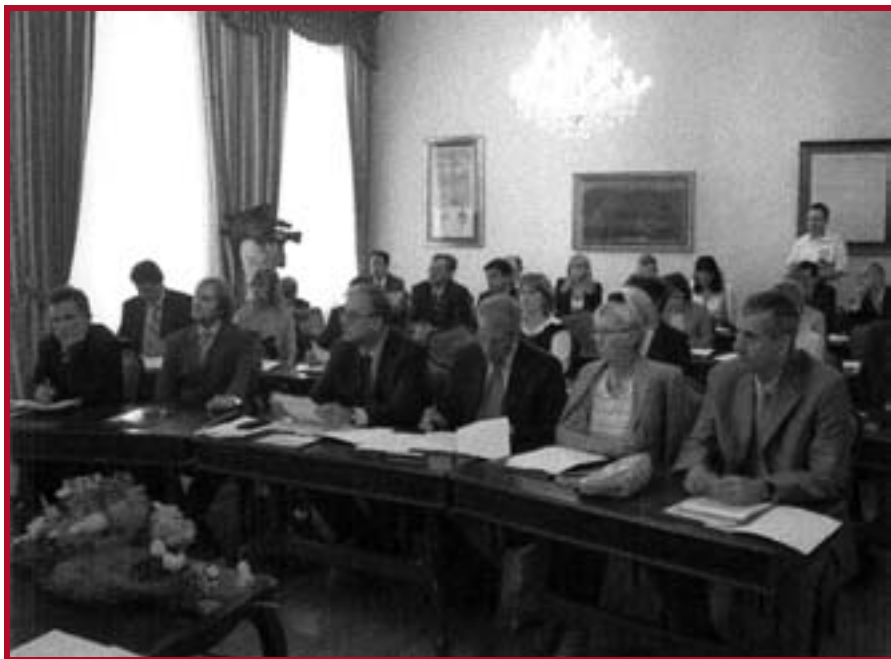
Конференција „Болоњска декларација као изазов“ у Марибору

дравио учеснике скупа у његовој финалној фази.