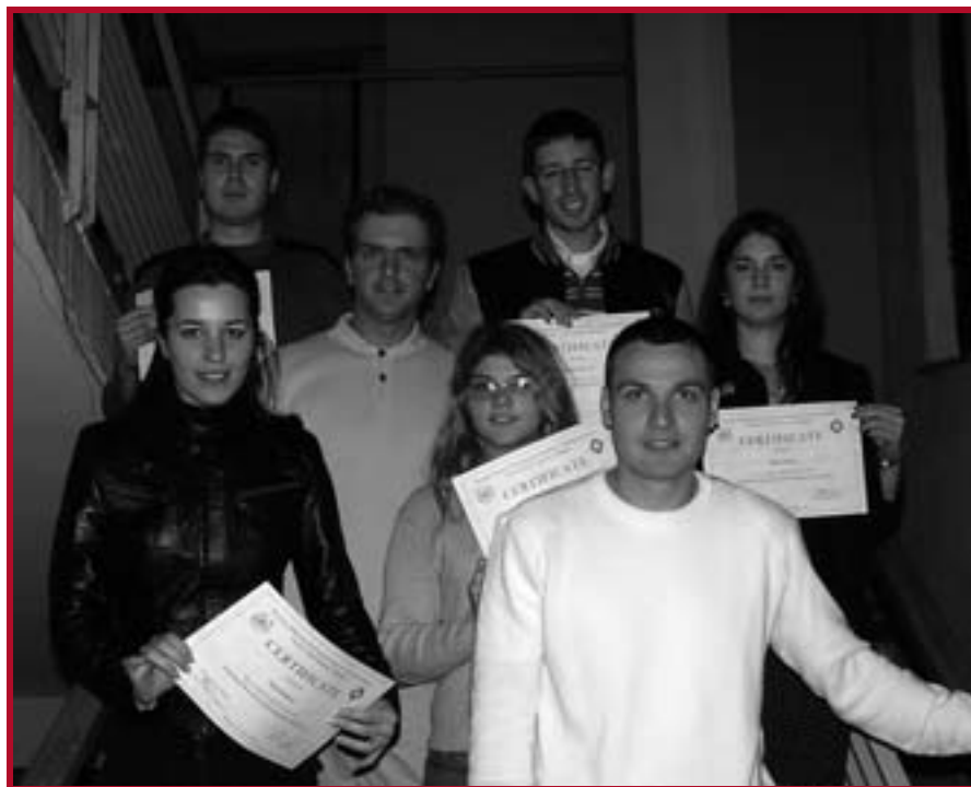
Полазници курса „Introduction into the EU Law“