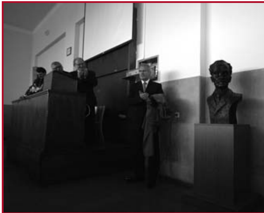
Откривање бисте Слободану Јовановићу

Слободан Јовановић је 1897. године постављен за ванредног, а 1900. године за редовног професора јавног права на Правном факултету у Великој школи. Од марта 1905. до 1940. године, с прекидом за време Првог светског рата, био је професор Правног факултета, декан Правног факултета школске