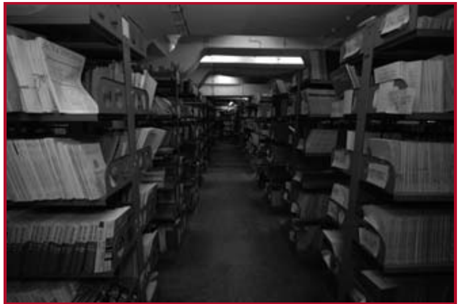
Библиотека Правног факултета

блиотеке учеснице састанка, утврђени су принципи размене монографских и серијских публикација, али и релевантних ин-