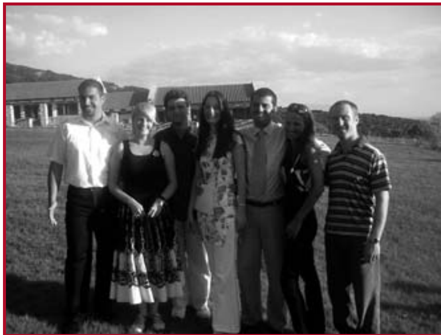
Наши студенти на семинару „Rule of Law and Democracy“ у Грчкој

У периоду од 28. августа до 11. септембра у месту Маронија, област Тракија у Грчкој, одржан је