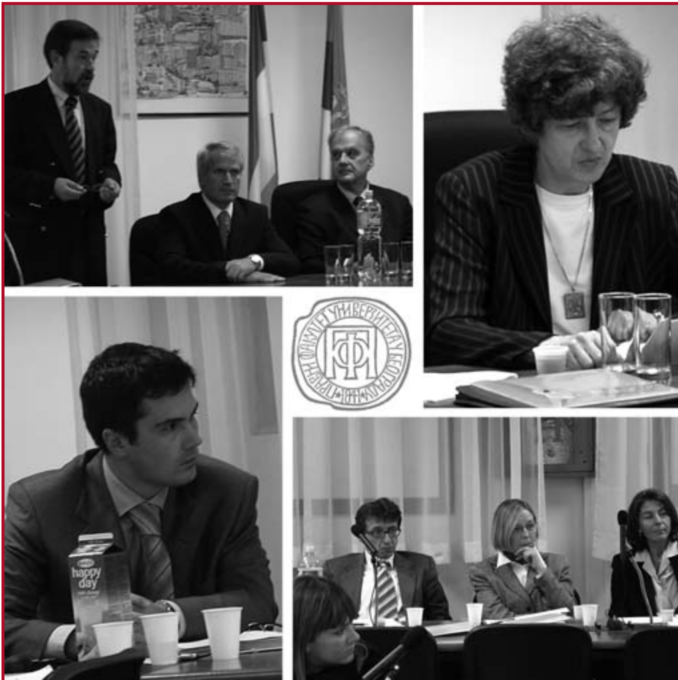
Учесници III међународне конференције о међународном приватном праву

и представљено седамнаест реферата који ће се ускоро наћи и у зборнику конференције. Учесници су изузетно позитивно оценили