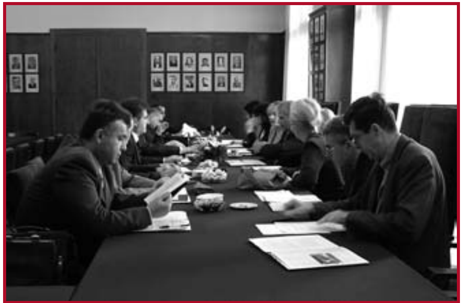
Конференција правних факултета Србије

На нашем Факултету је 19. октобра 2005. г. одржан састанак Конференције правних факултета Србије, на којој су се окупили декани и продекани свих државних правних факултета у Републици. После дуже анализе, усвојени су следећи закључци.