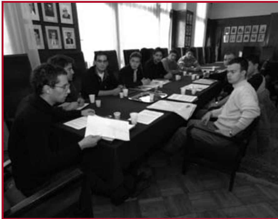
Конференција студената државних правних факултета Србије

Министарство за државну управу и локалну самоуправу.