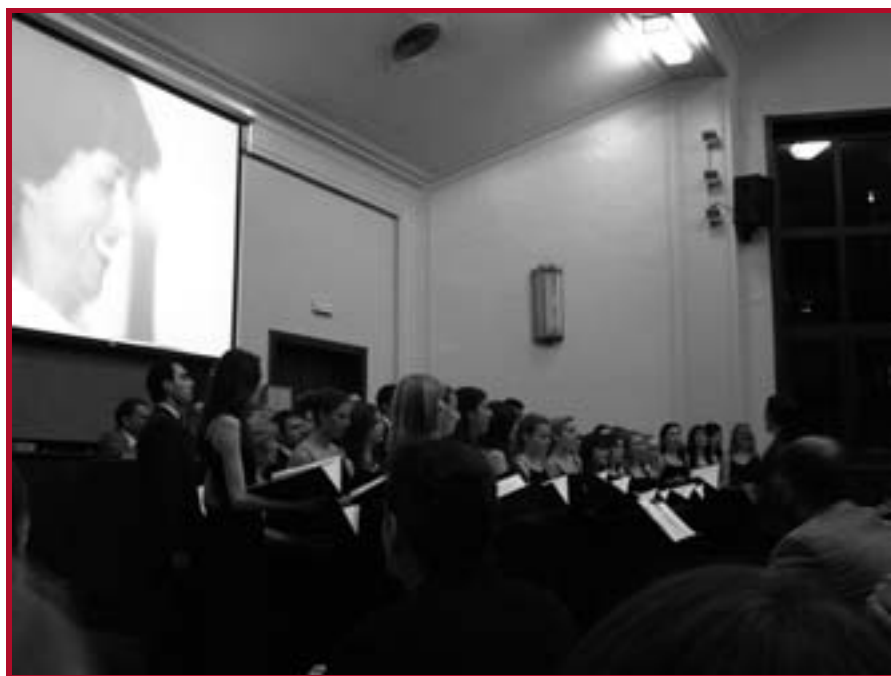
Свечана прослава 35 година клуба Forum Romanum