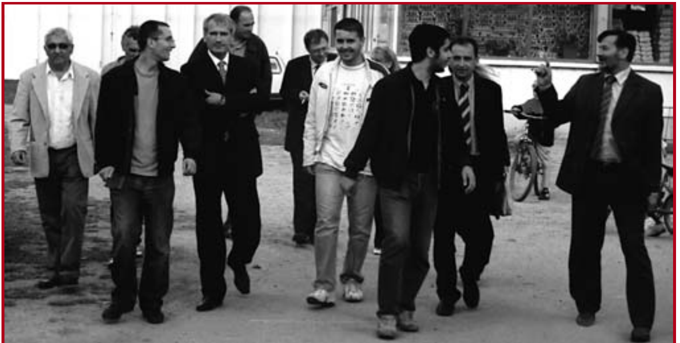
Управа нашег Факултета и представници студената у посету банатском селу Јаши Томић