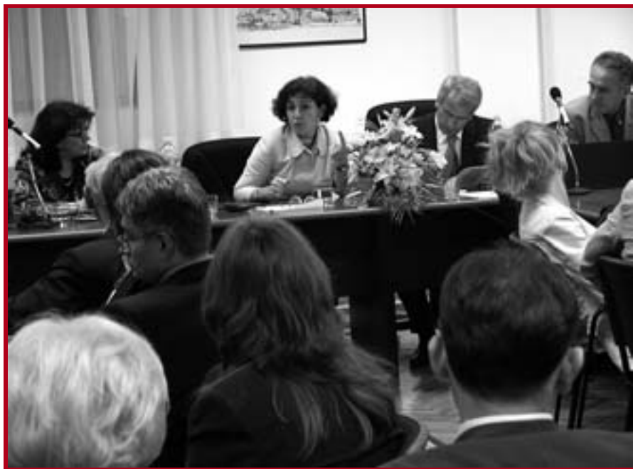
Учесници XVIII сасијанка Оишйеј семинара „Право на йравично суђење“