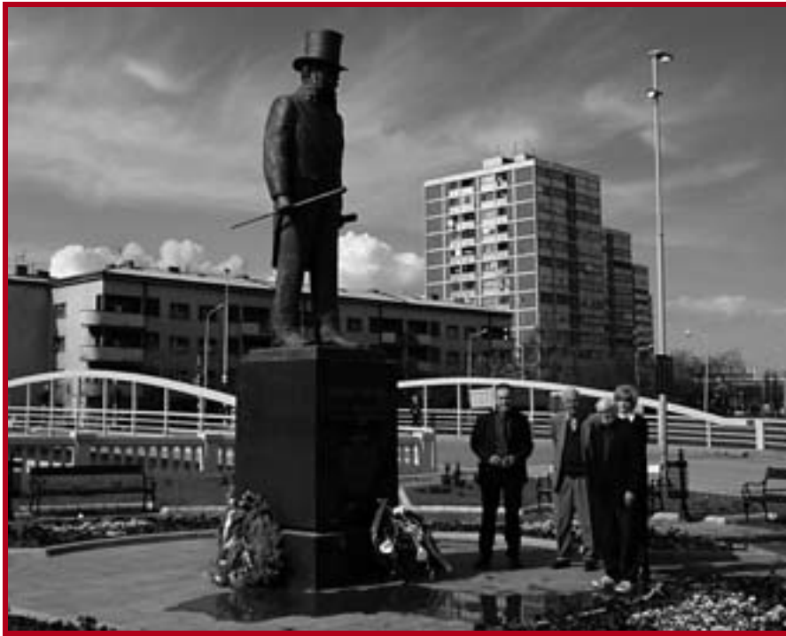
Испред сјоменика Јовану Ристићу