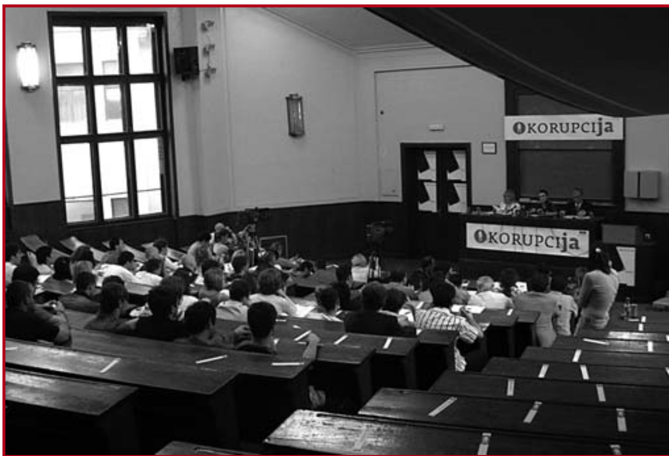
Трибина „Корупција на Универзитету“ у амфитеатру V

не праксе, у једној од судница Првог општинског суда, 20. маја, су доносили важне пресуде. Једни су се опробали у улози судија, а други су имали прилике да без стечене дипломе виде како је то бити адвокат, тужилац, али и окривљени. Овакву врсту наставе, која би ускоро могла да постане и обавезна на свим правним факултетима, већ четврти пут организује Удружење младих правника Србије, у сарадњи са Америчким удружењем правника и Фондом за отворено друштво. Више од 700 студената са правних факултета у Београду, Новом Саду, Нишу и Крагујевцу упознало се са судским животом, а многимима је ова пракса помогла и припремању испита.