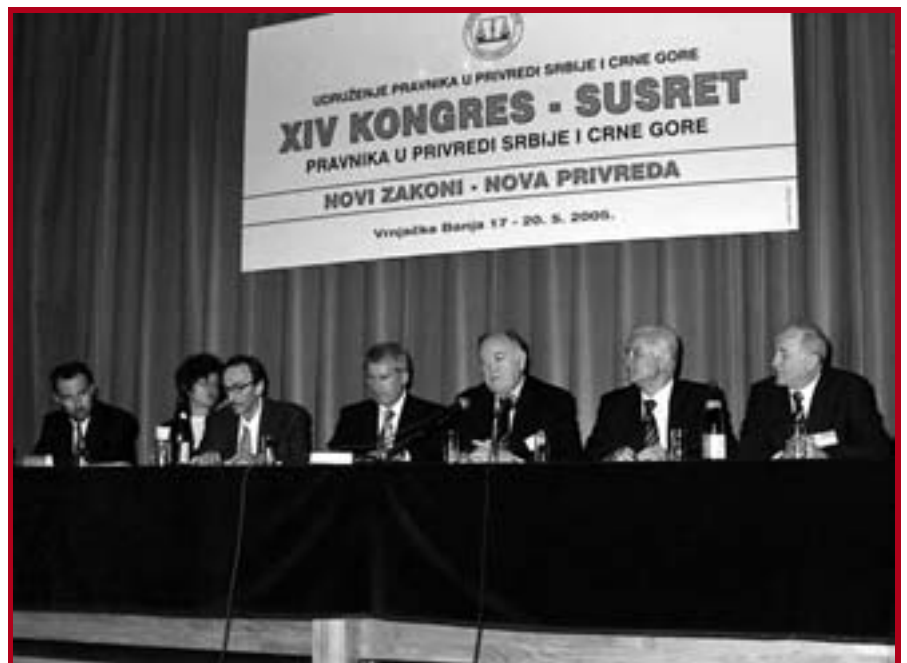
Радно председавајући 14. међународног конгреса правника у привреди