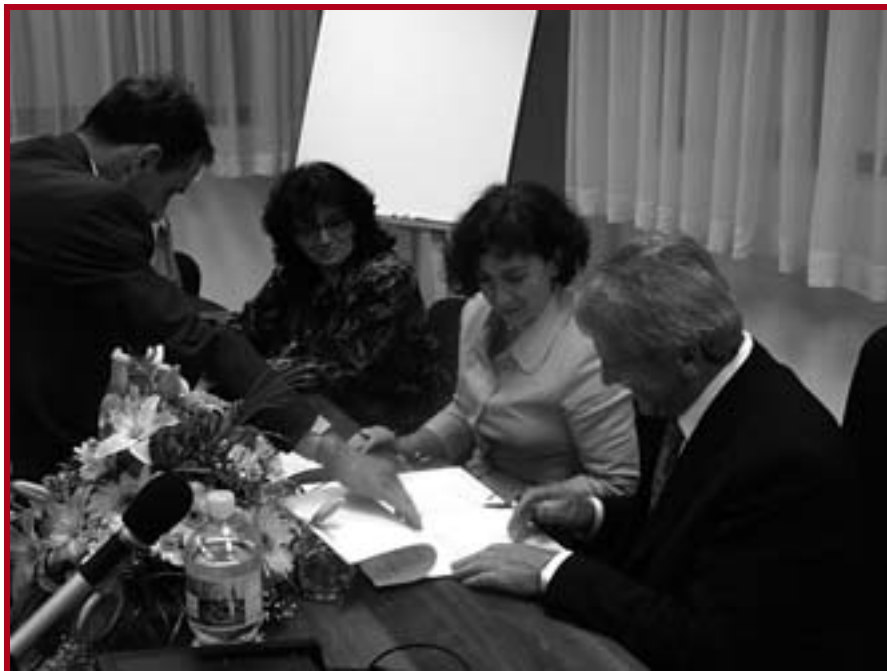
Потписивање Споразума о сарадњи Правног факултета Универзитета у Београду и Врховног суда Србије

Сарадња у оквиру пројекта „Правне клинике“, где студенти стичу посебна знања и вештине у пружању стручне правне помоћи ради јачања улоге права у решавању конфликта у друштву, развијају личне одговорности и правне кул-