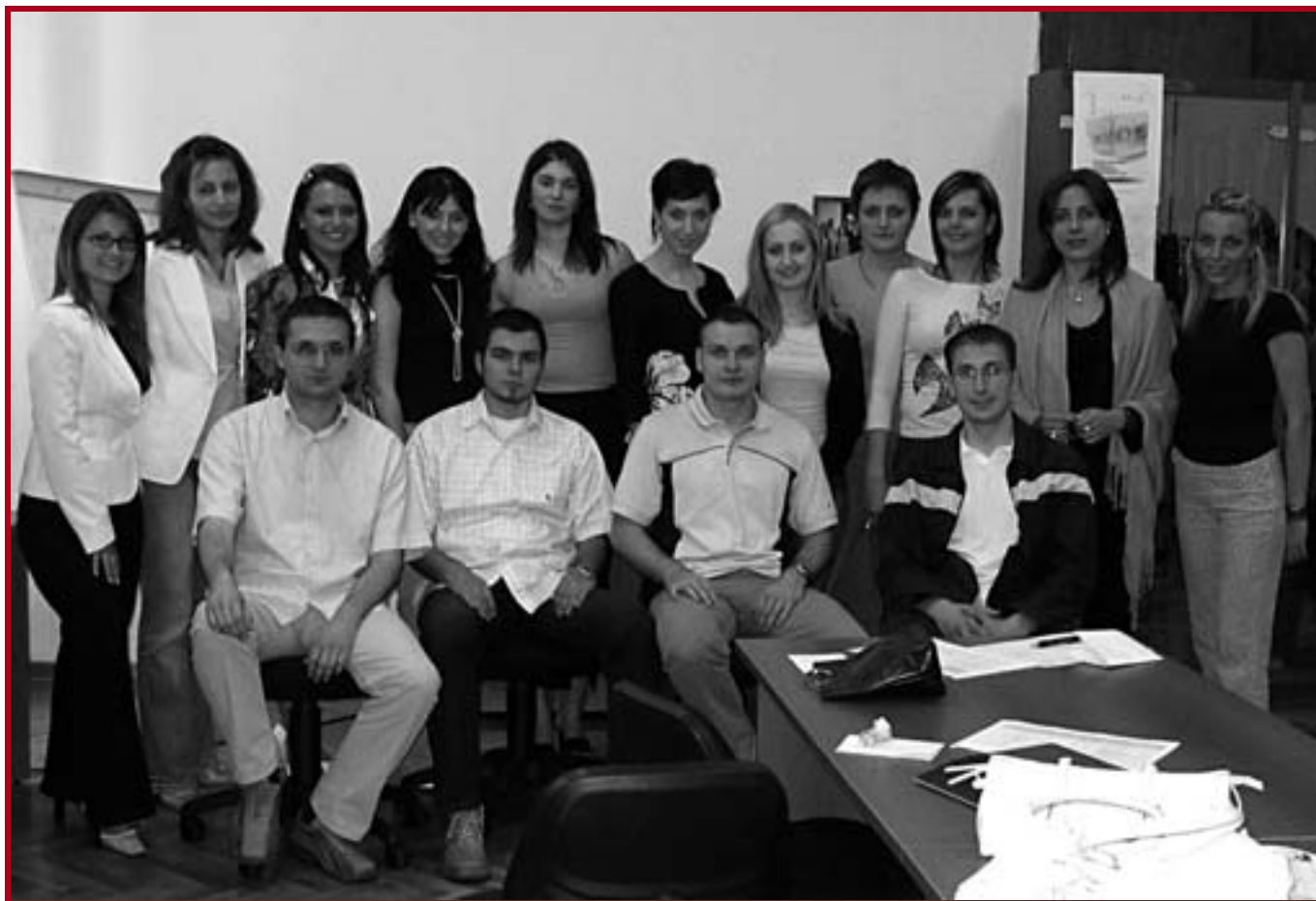
Полазници Правне клинике у школској 2004/2005. години