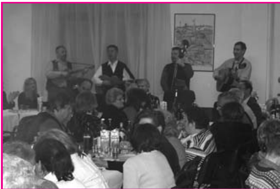
Прослава нове године на Факултету

испитног распореда, техничка модернизација свих амфитеатара Факултета, реконструкција Клуба наставника, организација нових специјалистичких курсева и курса припреме за правосудни испит, опремање студентске компјутерске лабораторије са великим бројем компјутера, започињање поступка оснивања фондације „Академик Радомир Д. Лукић“ и др.