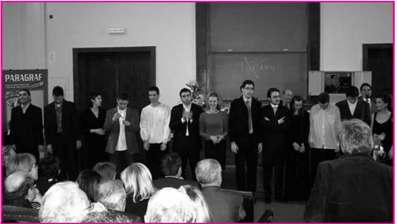
Учесници такмичења у беседништву