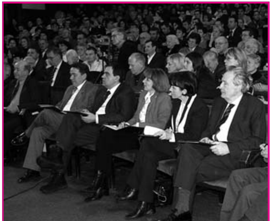
Чланови жирија на такмичењу у беседништву