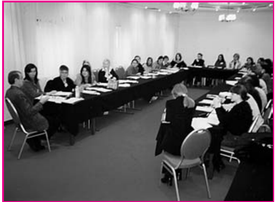
Учесници семинара „Права дејтеџа и малолетничко правосуђе“