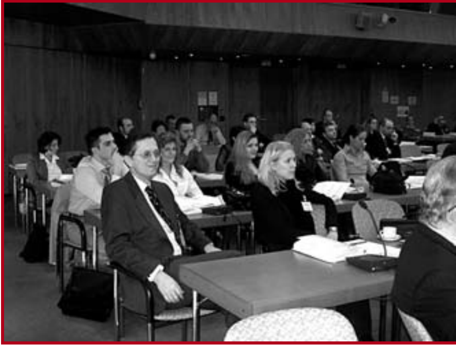
Учесници Међународне конференције у Бечу

Закон о арбитражи користећи Модел закон као полазну основу. Посебна пажња посвећена је питању привремених мера и будућем раду на подручју арбитраже.